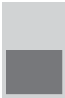
1/2 Seite 275 x 215 mm