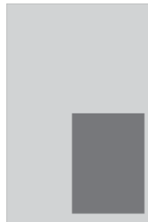
Eckfeldanzeige 155 x 215 mm